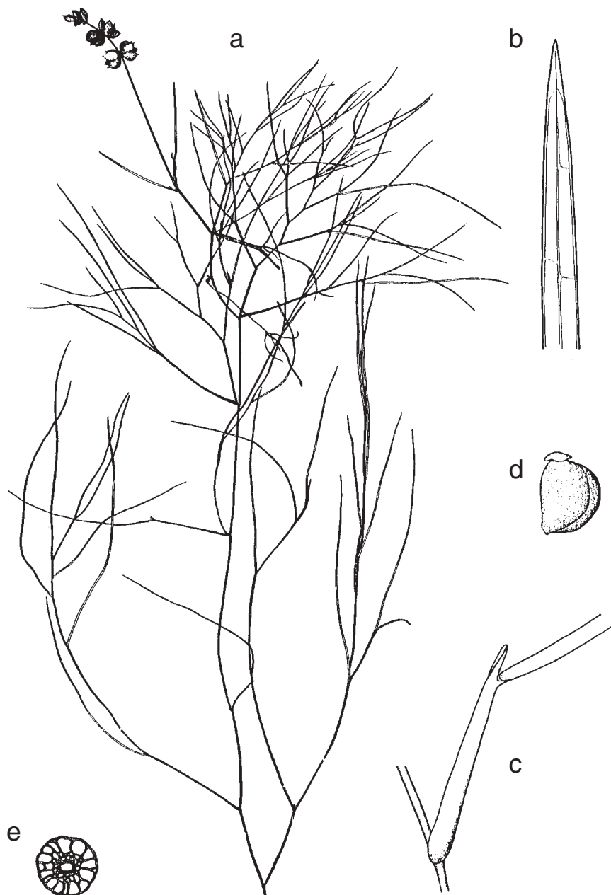
Obr. 1. – Potamogeton pectinatus : a – habitus; b – detail žilnatiny v horní části listu; c – palisty z větší části rostlé s bází listu, tvořící tak listovou pochvu; d – plod; e – příčný průřez horní částí lodyhy. (a, d, e – převzato z práce Mađalski 1977; publikováno se souhlasem nakladatelství Wydawnictwo Naukowe PWN, Varšava; b, c – nakreslil Z. Kaplan).

Fig. 1. – Potamogeton pectinatus : a – general habit; b – detail of venation in upper part of leaf; c – stipules adnate for most of their length to the leaf base (stipular sheath); d – fruit; e – cross-section of upper part of stem. (a, d, e – after Mađalski 1977; published with permission from Wydawnictwo Naukowe PWN, Warszawa; b, c – drawn by Z. Kaplan).