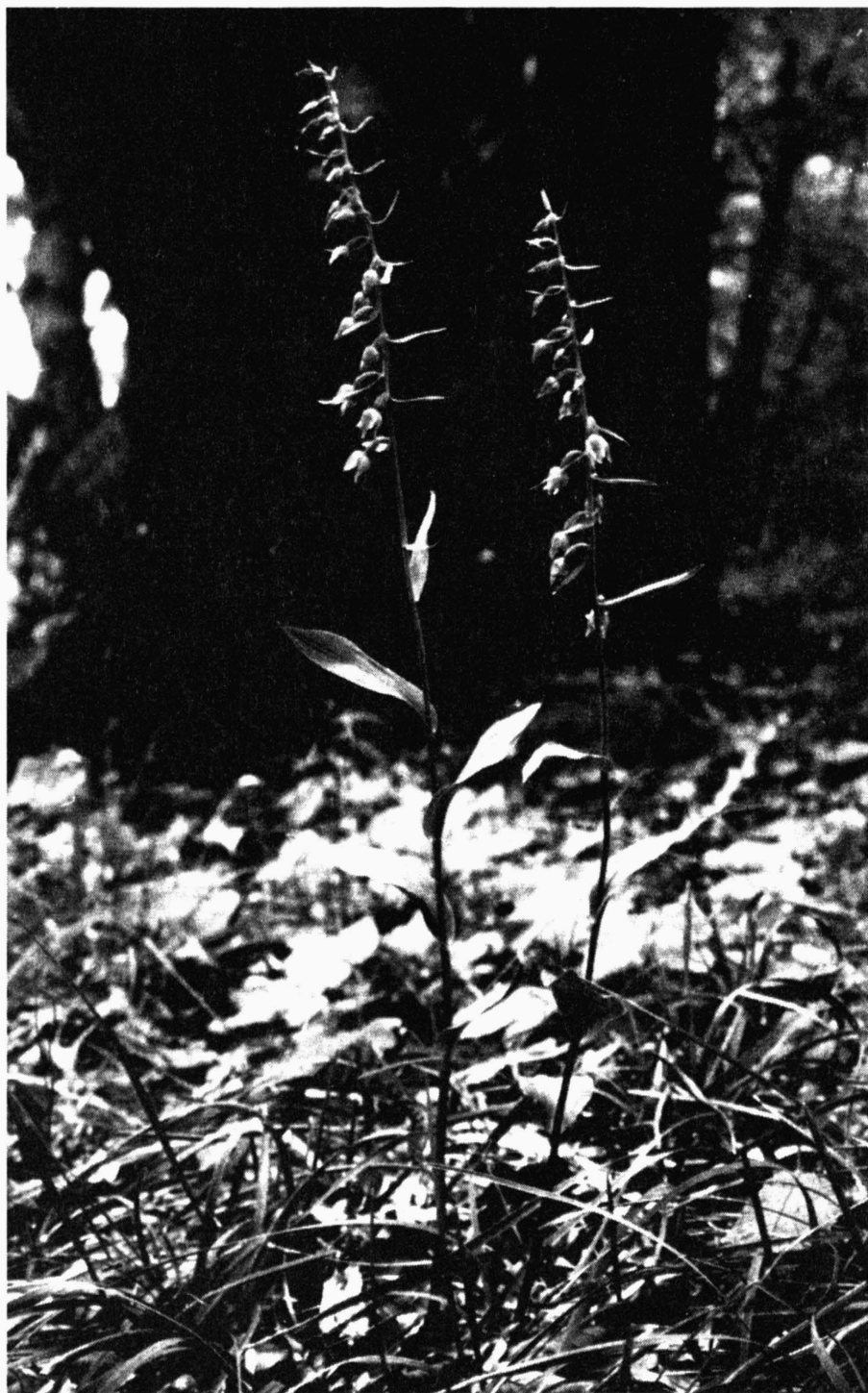
Abb. 3. – Epipactis komoricensis, spec. nova: Habitus. Ilava 20.7.1995.