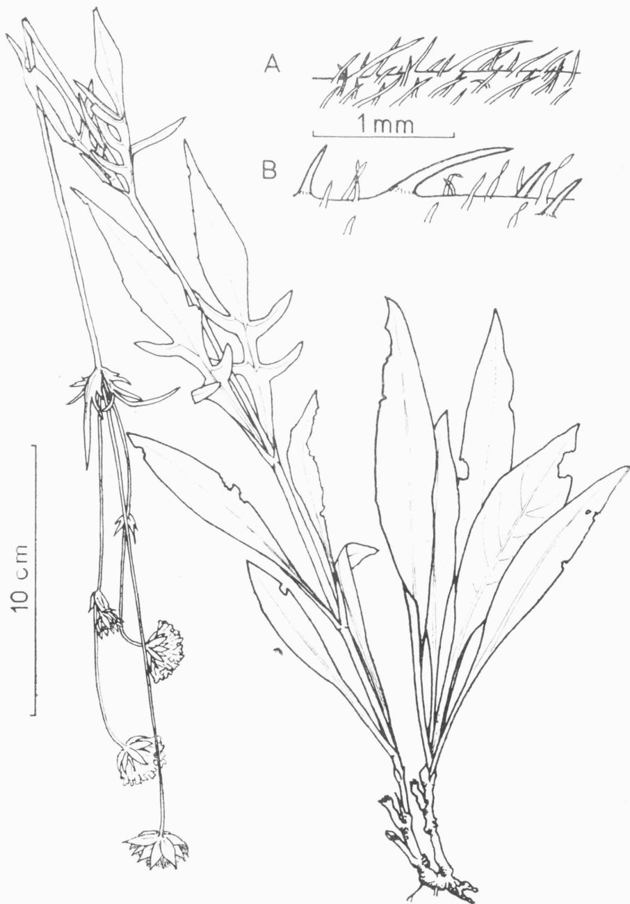
Abb. 1 — Knautia slovaca ŠTĚPÁNEK, holotypus. — Behaarung des Stengelblattrandes von K. slovaca (A) und K. arvensis subsp. arvensis (B).