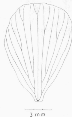
Abb. 1. — Ranunculus fluitans LAM. Kronblatt von der abaxialen Seite in Aufsicht, die Leitbündelanordnung zeigend (del. A. Chrtková).

Aus den angeführten nacheinanderfolgenden Messungen der Kronblattlänge unserer Art an einer Lokalität ergibt sich, dass im Juni, zur Zeit des reichlichsten Blühens dieser Art die Kronblätter am längsten, in späteren Blüten (August, September) hingegen durchschnittlich deutlich kürzer sind. Für Ranunculus fluitans kann demnach an der Lokalität Zadní Třebáň, allerdings nur auf Grund von Messungen während einer Vegetationsperiode, festgestellt werden, dass sich die Kronblattlänge von 7 bis 16 mm bewegt und die Durchschnittslänge 11,35 mm beträgt. [Cook (1966) gibt für R. fluitans eine Kronblattlänge von 7 bis 13 mm an.]