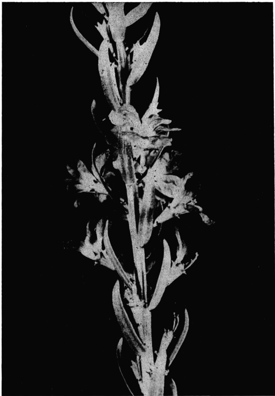
J. Toman und F. Starý: Lythrum junceum BANKS et SOLAND in RUSS. — eine in die Tschechoslowakei neu eingeschleppte Art