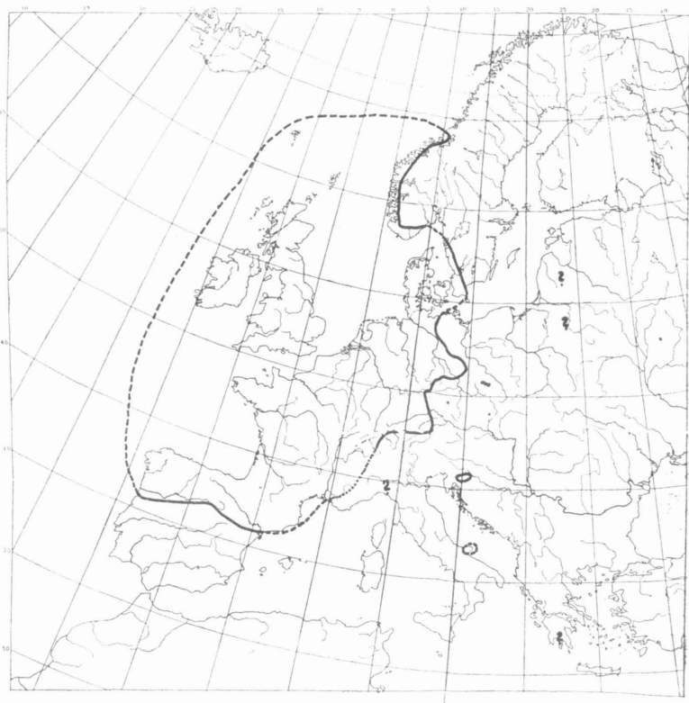
Obr. 1. — Areál H. pulchrum L. (Sporná hranice tečkovaná.) The area of H. pulchrum L. (doubtful limit dotted).