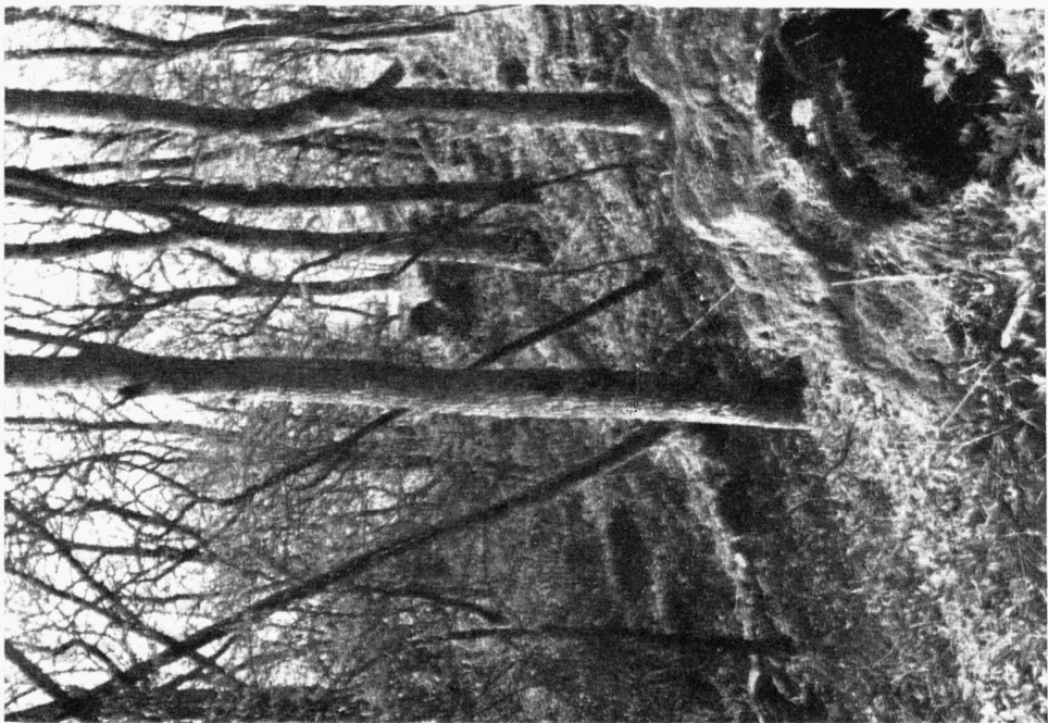
M. Moravcová-Husová: Die Fagetalia-Gesellschaften des Gebirges Branschauer Wald (Branžovský hvozd) in Westböhmen