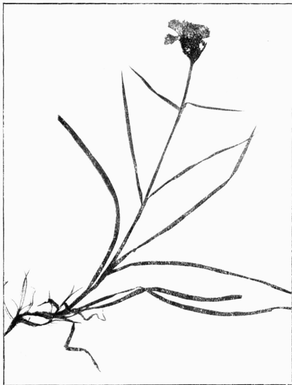
Dianthus Carthusianorum L. var. SVIDOVIENSIS m. (H. m. no. 681).