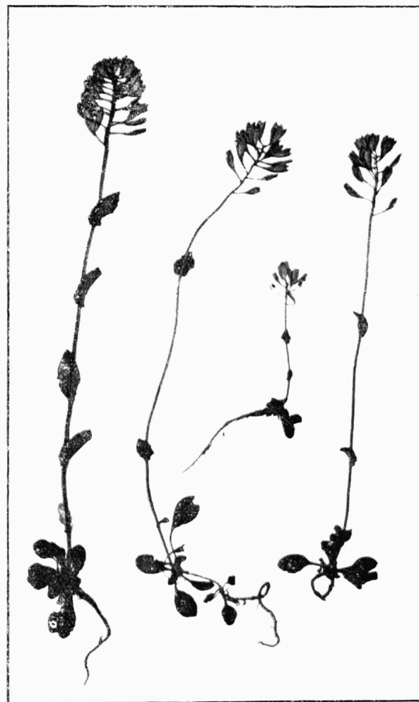
Thlaspi Dacicum HEUFF. (H. m. no. 1448).